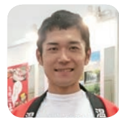
安達文俊次長 九州観光推進機構

日田温泉旅館では屋形船が楽しめるのが特徴。夏はお座敷に仕立て涼を求めて操り出し、5月20日～10月末迄の鮎魚の期間には「鶴飼い」の妙技を鑑賞することもできます。秋には名月を愛で、冬は障子とコタツを備えた雪見船。四季折々の船遊びを堪能してください。